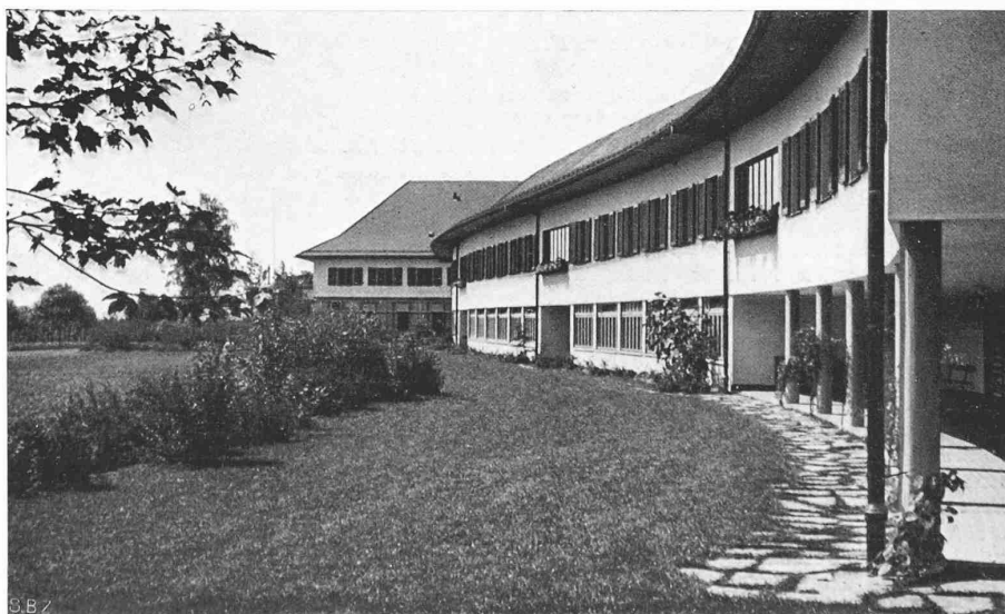
Abb. 20. Blick vom Ende des Zöglingsflügels gegen den Hauptbau im Westen

Zum Schluss sei noch auf die erfreuliche Tatsache hingewiesen, dass die Ausführung mit dem Wettbewerbsentwurf von 1936 in der Gesamtanlage, im Zöglingsflügel auch im Einzelnen fast genau übereinstimmt. Wieder einmal ein Wettbewerb mit vollem Erfolg!