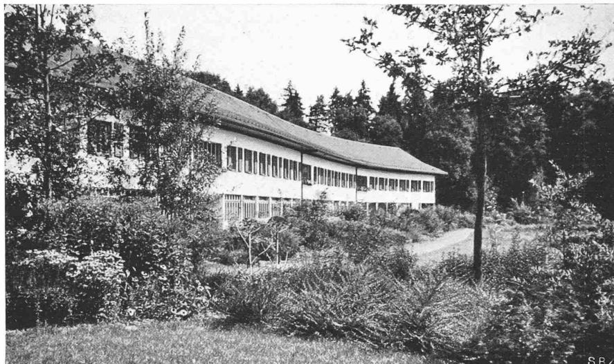
Abb. 19. Zöglingsflügel gegen das östliche Ende, Südfront

wundervollen Erdenfleck. — Die in Holz konstruierten landwirtschaftlichen Schuppen dienen zur Haltung von Kleinvieh, wie Hühner, Schafe, Schweine, Kaninchen usw., um die Abfälle rationell verwerten zu können. Neben diesen Ställen ist ein Geräte- und Heuschopf errichtet. Die Einrichtungen der Hühner- und Schweinestallungen sind nach den heutigen Empfehlungen unserer landwirtschaftlichen Schulen errichtet worden.