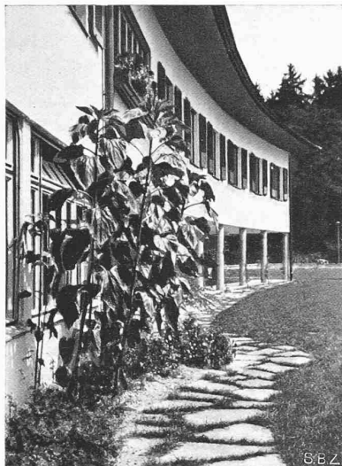
Abb. 18. Ende des Zöglingsflügels