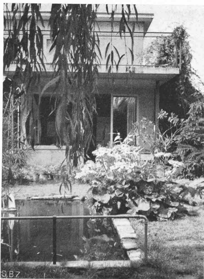
Abb. 8. Blick vom Sandplatz