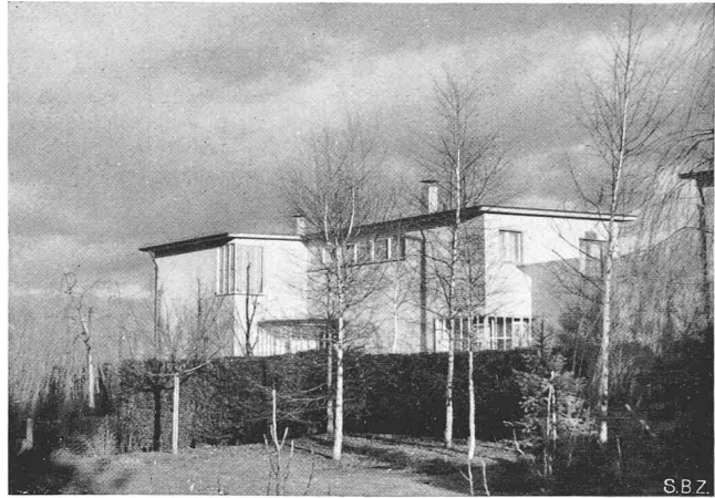
Abb. 5. Winterbild aus Westen, mit dem Schatten des Nachbarhauses