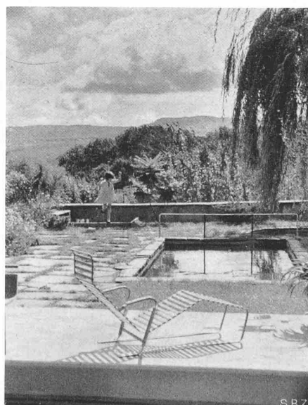
Abb. 9. Fernsicht auf die Jurahöhen