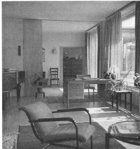
Abb. 11. Durchblick gegen das Esszimmer

schinen auf etwa 6 Mio Kilowatt und die jährliche Erzeugung auf rd. 20 Mia kWh gesteigert werden können. Das zeigt unzweideutig, dass sogar die Gesamtleistung aller unserer bestehenden und ausbauwürdigen Wasserkraftanlagen bei vollständiger Elektrifizierung der Heizeinrichtungen bei weitem nicht für die Deckung unseres heutigen Bedarfes ausreichen würde. Zudem wäre es unmöglich, den künftigen Mehrbedarf an hochwertiger motorischer und Lichtenergie durch unsere Wasserkraftanlagen zu decken.