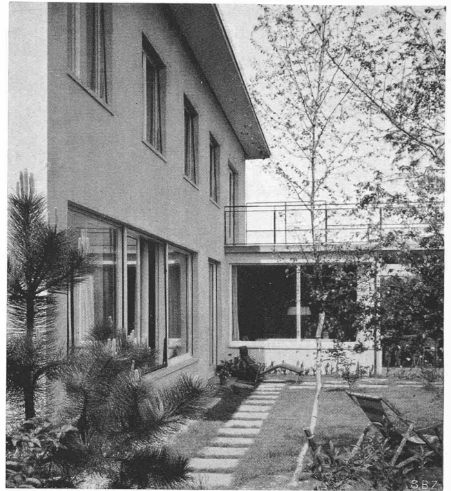
Abb. 7. Streifbild aus Südwest gegen die Veranda

Der Eis- und Gletscherforschung bieten sich heute, dank der Fortschritte der angewandten Physik, sowie der auf den verschiedensten Gebieten erfolgten Vervollkommnung der Untersuchungsmethodik, ganz neue Möglichkeiten. Als erfolgversprechende Methoden seien in Ergänzung der bisherigen Ausführungen erwähnt: die Bestimmung der Gletscherdicke durch seismische und Funkmutung [19], die Stereophotogrammetrie, die