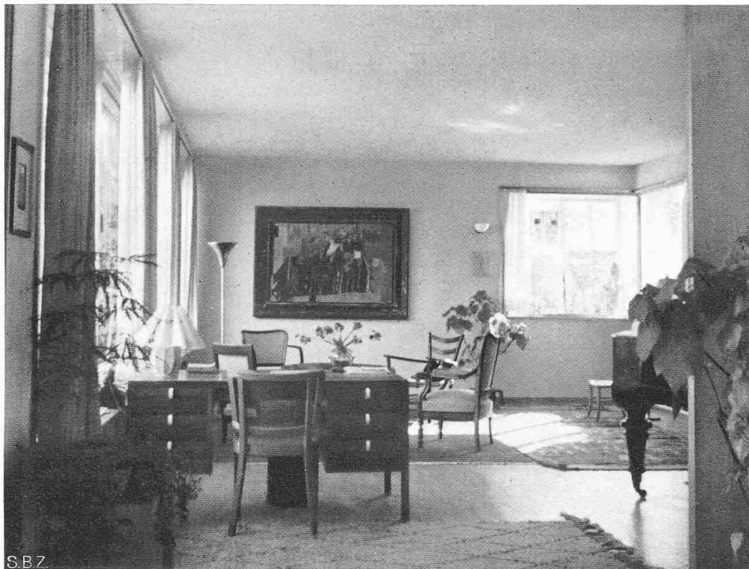
Abb. 10. Das Wohnzimmer im Hause Hermann Baur, Basel