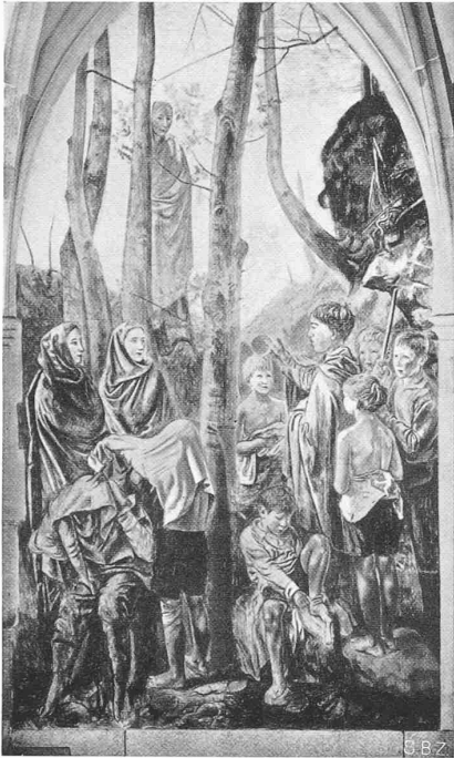
Abb. 1. Taufe der Kinder Felix und Regula