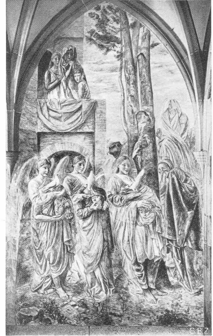
Abb. 3. Die enthaupteten Märtyrer