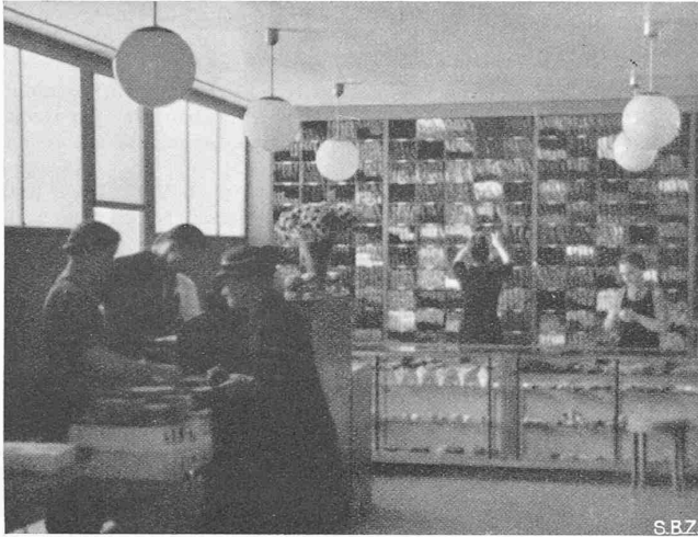
Abb. 4. Innenbild

Mit «Zenitlicht» aufgehellter Laden der Firma Wollen-Keller, Zürich