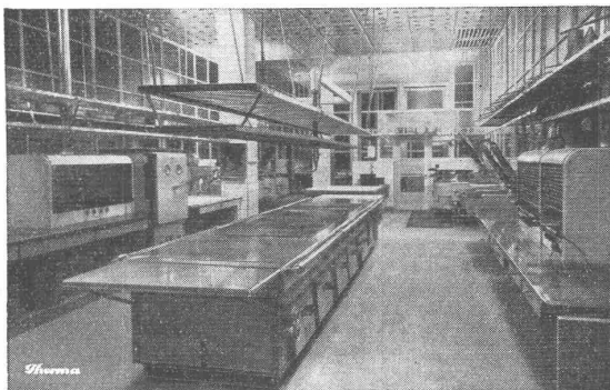
Elektro-Küche Therna im Kongresshaus, Zürich

wurden durch uns geliefert. Die handgewobenen Stoffe stammen aus unserer eigenen Webstube.