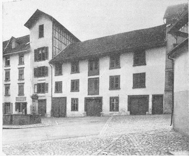
Der «Tümpfel» in Bischofszell, links schlecht erneuert, rechts im früheren Zustand

Abteilungen in dreigeschossigen Bautrakten zu einer harmonischen Gesamtanlage zusammenzufassen. Die Fassaden, die einen wohnlichen Charakter wahren, sind sehr gut. Bemerkenswert ist auch die Führung der obren Waidstrasse dem Waldrand entlang in der Richtung gegen die Wirtschaft Waid.