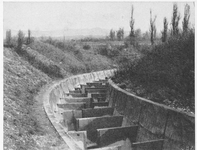
Bild 2. Blick in den neuen Fischpass des Stauwehrs Kembs