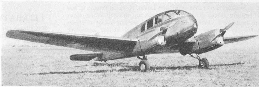
Das Sportflugzeug «Aero Ae 45»

Ueber bakteriologische Untersuchungsergebnisse an geschlossenen Trinkwasserbehältern berichtet Dr. S. Hoffmann, Hygiene-Institut der E. T. H. in «Strasse und Verkehr» Nr. 19/20 vom 26. Sept. 1947. Darnach wurden Behälter von 1 bis 4000 m 3 Inhalt während Beobachtungszeiten bis zu vier Jahren untersucht und festgestellt, dass an sich reines Trinkwasser nach einwandfreiem Einfüllen — am besten durch feste Leitungen — in einwandfreien Behältern ohne Kontaktnahme mit aussen keinerlei Einbusse seiner ursprünglichen Güte erfährt, auch wenn es über Jahre gelagert wird. Desinfektionsmassnahmen sind nur bei bakteriologisch schlechtem Wasser nötig. Hierfür wird Chlor verwendet, entweder in schwacher, an der Geruchschwelle liegender Konzentration (0,2 bis 0,45 mg/l, entsprechend 0,5 g Caporit pro m 3 ) oder in hoher Ueberdosierung und nachheriger Entchlorung durch Aktivkohle-Filtration, dies namentlich bei kleinen Behältern. Störend wirkt hierbei die Chloratmosphäre, während die bakteriologische Wirkung günstig ist. Man kann auch das Wasser mit Tonerde-Filterkerzen, am besten vor dem Gebrauch, reinigen, wobei aber diese Kerzen mit der Zeit verstopfen. Will man sie zum Regenerieren auskochen, so entstehen leicht Haarrisse, wodurch sie für Bakterien durchlässig werden. Nach-