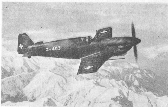
Bild 1. Ansicht des Jägers D 3802 A im Flug

Wie liegen nun die Verhältnisse am Tré-la-Tête-Gletscher im Hinblick auf die Untergletscher-Wasserfassung? Die Zunge des rd. 7,2 km langen Eisstromes mit 10,8 km^2 Oberfläche reicht auf 1900 m Meereshöhe herunter, während der Wasserspiegel an der Entnahmestelle auf Kote 1921,50 m vorzusehen war. Da der Gletscher in eine steile Fels-Schlucht ausmündet, durfte von Anfang an damit gerechnet werden, dass die Wasserfassung in nicht allzu grosser Entfernung vom Gletscherende erstellt werden könnte. Mit einem 300 m langen, durch das Eis vorgetriebenen Horizontalstollen wurde der Verlauf des Gletscherbaches unter dem Eis ermittelt und dabei festgestellt, dass dieser Bach eine tiefe, drei bis sechs Meter breite Erosionsrinne ausgefressen hatte. Der gesamte Gletscherabfluss konnte in dieser, übrigens stets eisfreien Felsrinne ohne besondere Schwierigkeiten hinter einer Ueberlaufstaumauer gefasst und durch einen Stollen abgeleitet werden, wie wenn es sich um die Wasserentnahme aus einem Wildbach unter freiem Himmel gehandelt hätte. Zudem weist die Sohle des Wasserlaufes unter dem Gletscherende ein so grosses Längsgefälle auf, dass die Nebeneinrichtungen der