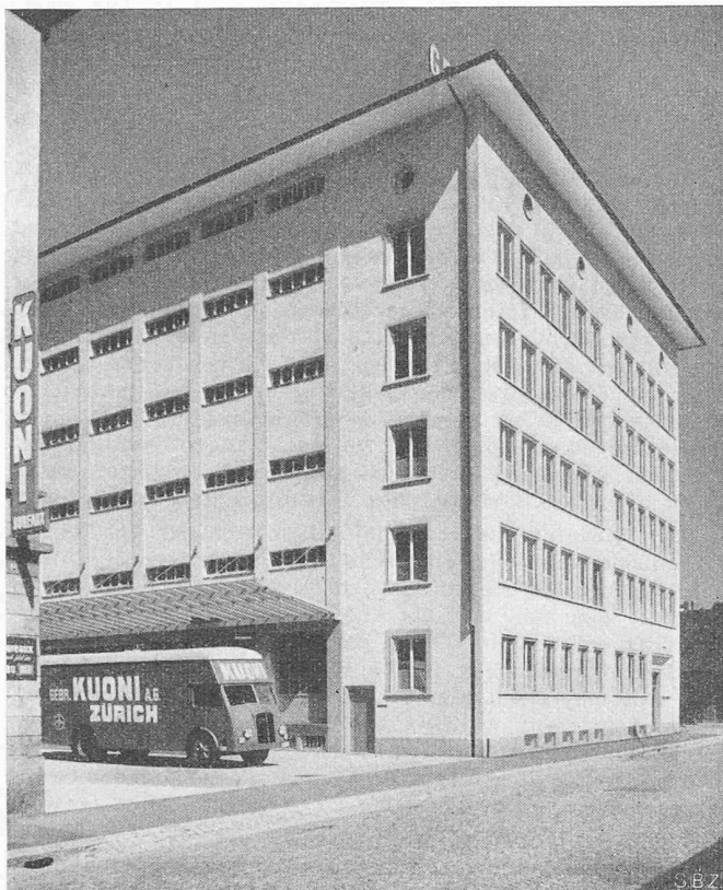
Bild 11. Hofeinfahrt an der Neugasse