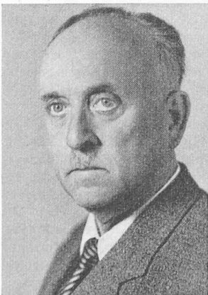
G. LEUENBERGER ARCHITEKT

Als im Jahre 1922 die Ortsgemeinde infolge Sparmassnahmen die Stelle eines Architekten aufhob, gründete Lang ein eigenes Architekturbureau, mit dem er dank seiner aussergewöhnlichen Energie und seiner soliden Berufsauffassung sich bald die Wertschätzung seiner Auftraggeber erwarb. Zahlreiche Wohnbauten besten Stils zu Stadt und Land ent-