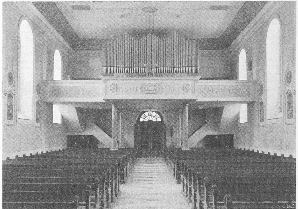
Bild 1. Katholische Pfarrkirche Biberist, Schiffrückwand vor 1949