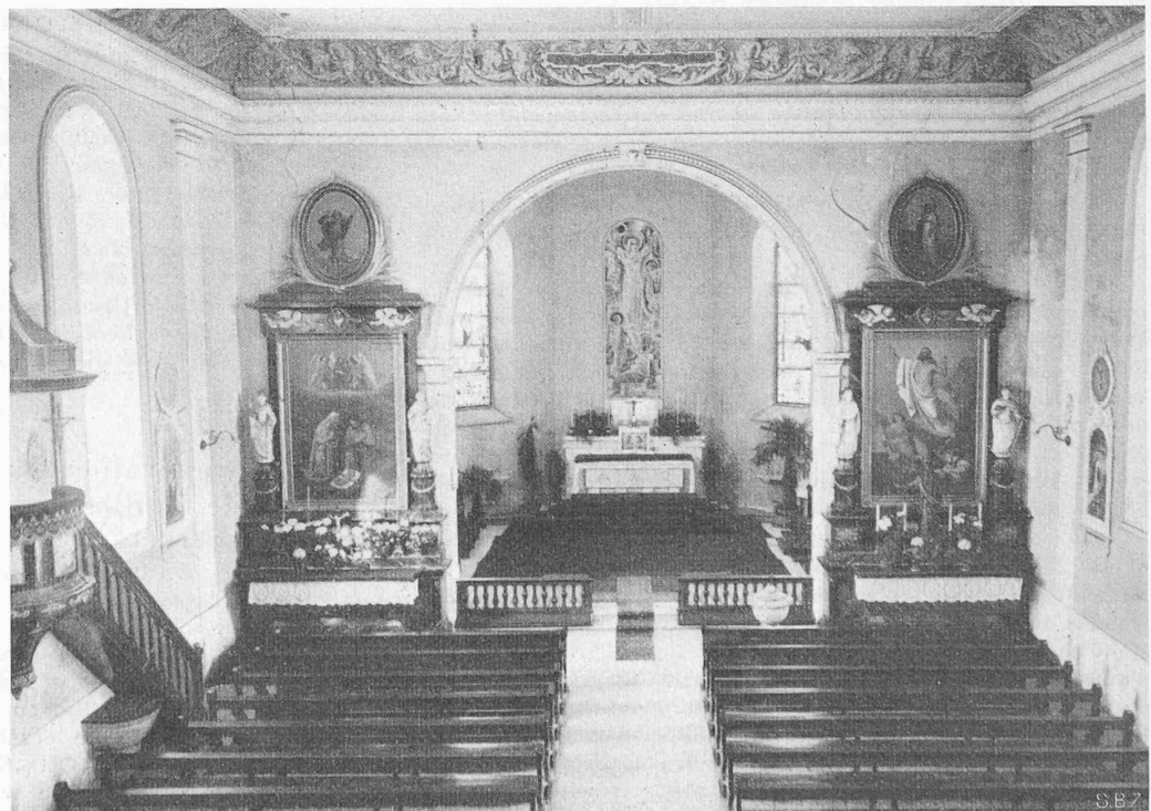
Bild 3. Chorpholie vor der Umgestaltung