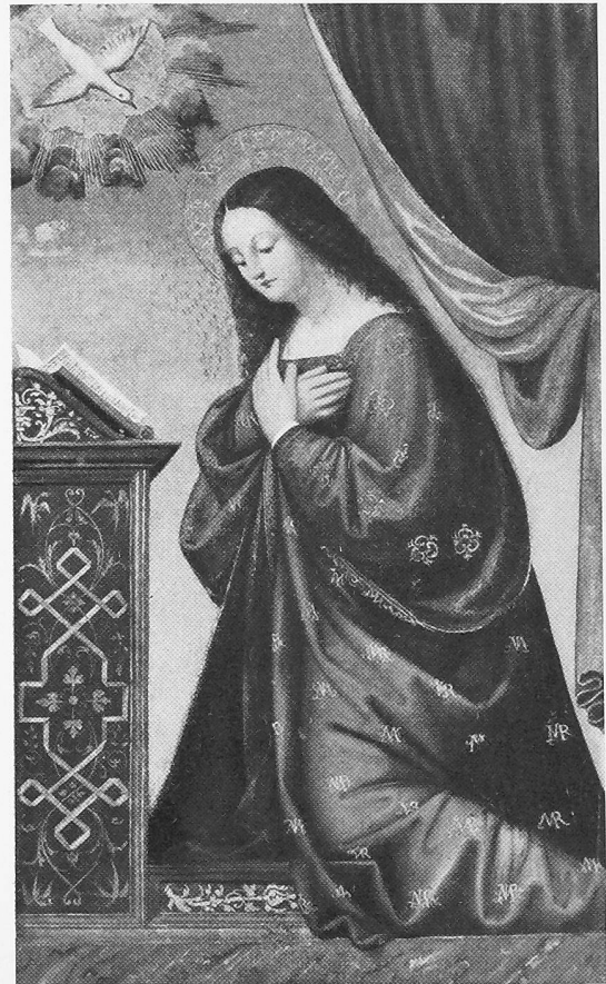
Maria der Verkündigung