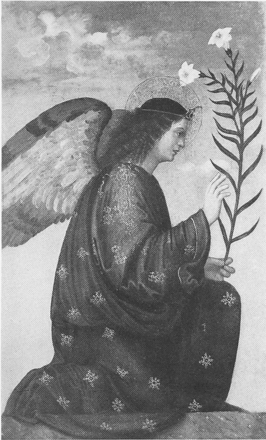
Engel der Verkündigung