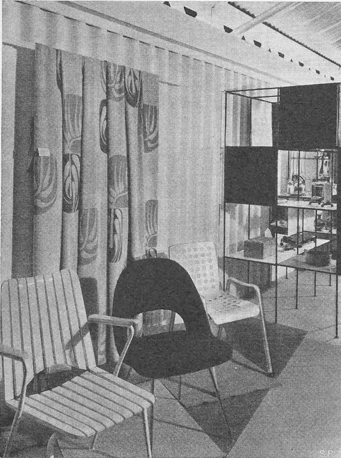
Bild 1. Detail der Gruppe Sitzmöbel aus der Sonderschau «Form und Farbe» des SWB an der Mustermesse Basel 1951.