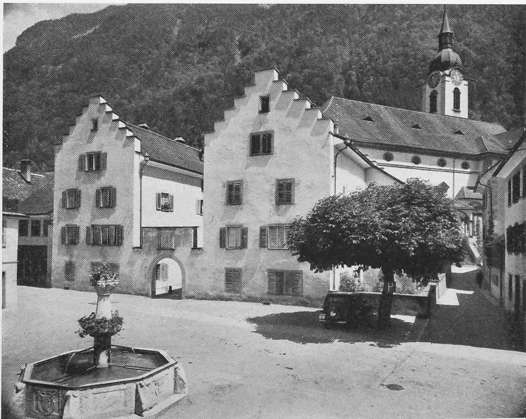
Das Fremdenspital in Altdorf