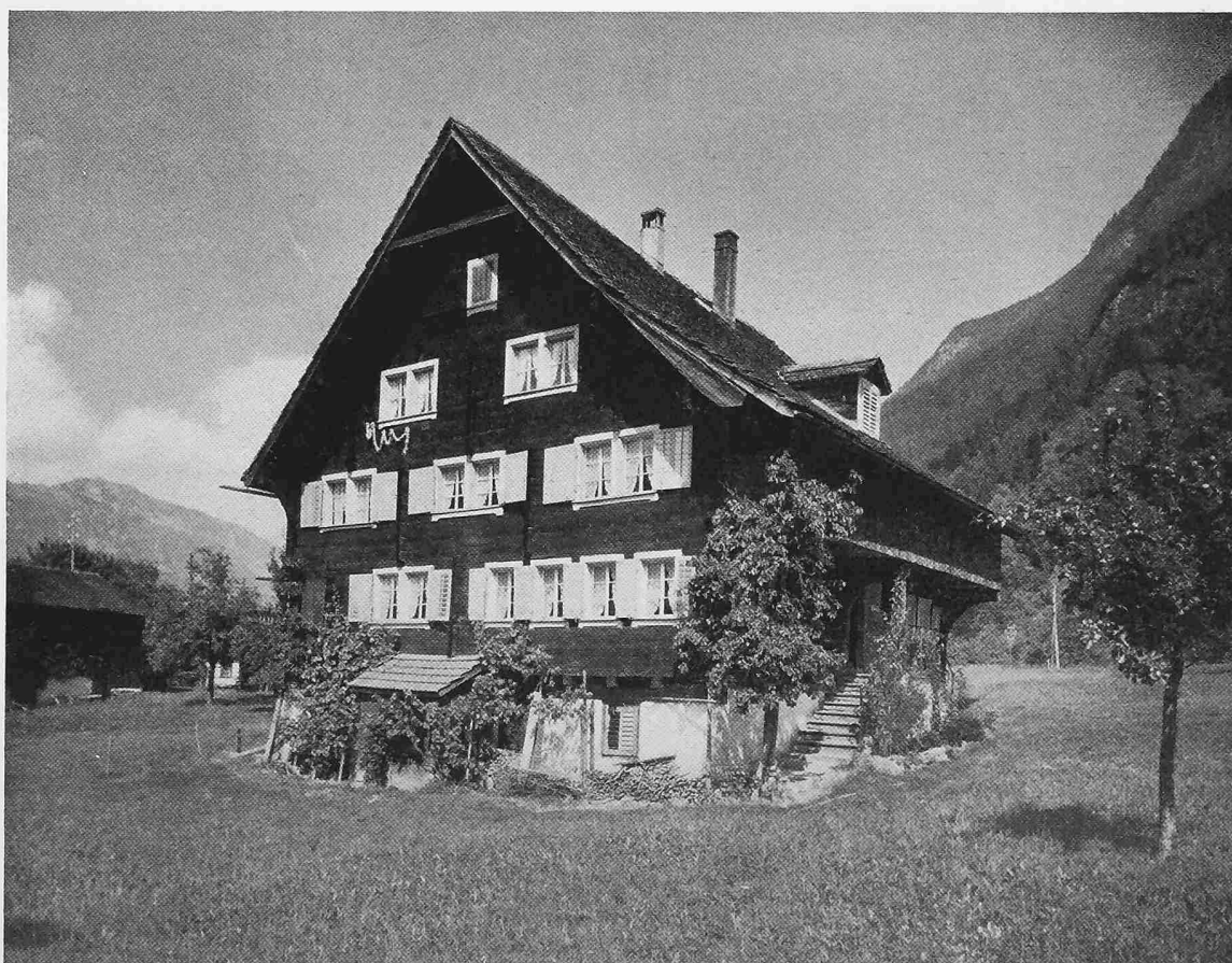
Haus in der Balmermatte in Bürglen, erbaut 1636, Südost-Fassade

Aus «Das Bürgerhaus im Kanton Uri», 2. Auflage, herausgegeben vom S. I. A. im Orell Füssli Verlag, Zürich