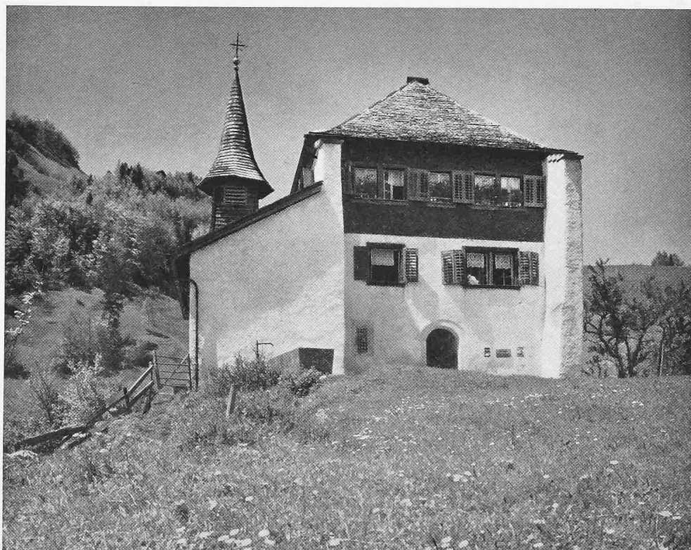
Schlösschen Beroldingen bei Seelisberg, Ostfassade. Mitte 16. Jahrhundert

Aus «Das Bürgerhaus im Kanton Uri», 2. Auflage, herausgegeben vom S. I. A. im Orell Füssli Verlag, Zürich