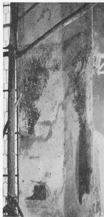
Bild 4. Das Marienbild nach seiner Zerstörung durch barbarische Bilderstürmer