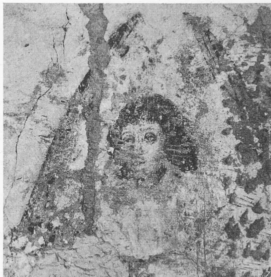
Bild 2. Engelsköpfchen vor der Zerstörung, die vorzügliche Zeichnung ist trotz dem mangelhaften Erhaltungszustand klar erkennbar

uns an den Fall von Stammheim, wo die Kirche «aus Versehen» nicht abgeschlossen wurde, bis die neu aufgedeckten Malereien zerkratzt waren (siehe SBZ Bd. 82, S. 111*, 1. Sept. 1923), und inzwischen ist da und dort doch noch Köpfe und Winkel gibt, die seit 1529 nicht mehr gelüftet worden sind. Und peinlich ist es zu denken, dass es eine Art kirchlicher Knüppelgarden oder Rollkommandos offenbar als ständige Einrichtung gibt, «sanctae simplicitates», die zur Verfügung stehen, das zu tun, was der Herr Pfarrer oder Kirchenpfleger nicht gerade selbst besorgen will, von dem er aber wünscht, dass es besorgt wird — worüber das Nötige im Faust II bei der «Liquidation» von Philemon und Baucis nachzulesen ist.