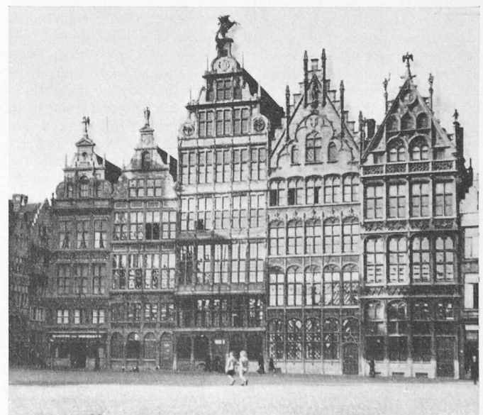
Bild 1. Niederfränkische verglaste Skelettbauten aus vier Jahrhunderten am Grossen Markt in Antwerpen

Eine Maschinenfabrik, eine Spinnerei oder Weberei wird auch in unserm Alpenraum als Stahlbetonskelett mit viel Glas gebaut, ohne dass man sich deshalb als besonders modern vor kommt. Bei einem neuzeitlichen Wasserkraftwerk ist diese