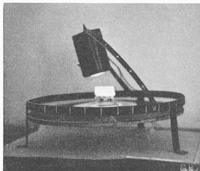
Das Insoloskop (Legende im Text, S. 22)