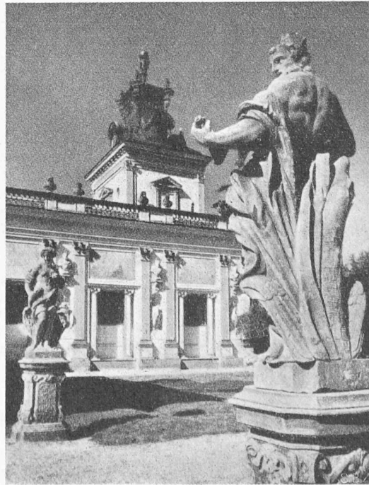
Bild 2. Teilstück des Palastes in Wilanow bei Warschau, erbaut 1678 bis 1694. Arch. A. LOZZI