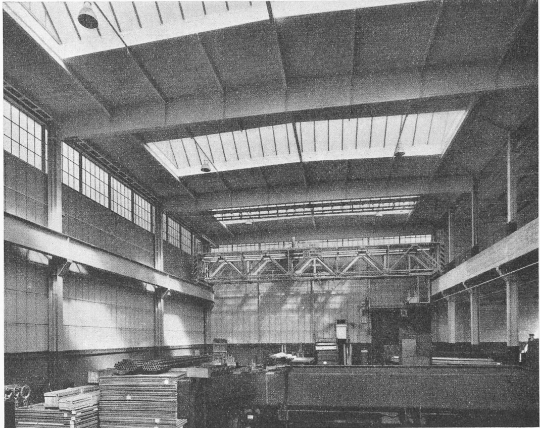
Bild 1. Blick in die Bearbeitungshalle; rechts Eisenbetonbrüstungsträger als Kranbahnträger

Mit Rücksicht auf eine gute Ausnutzung der Grundrissfläche ist die Lagerhalle zweigeschossig angeordnet mit je 4 t/m 2 Nutzlast. Die Lagerräume werden bedient durch fahr-