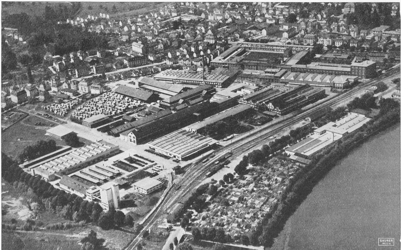
Aktiengesellschaft Adolph Saurer, Arbon: Werk II beim Bahnhof