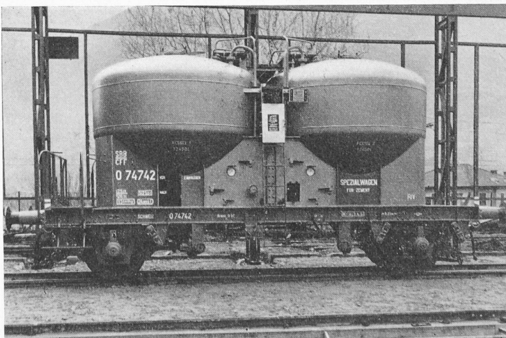
Zementtransportwagen der SBB (aus «SBB-Nachrichtenblatt» 1953, Nr. 6).