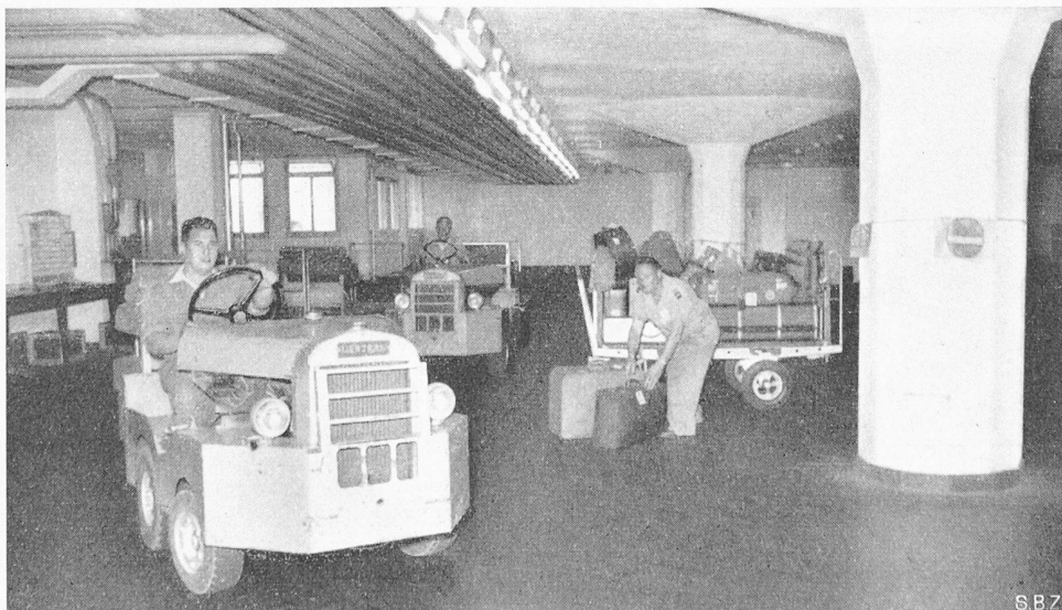
Bild 43. Gepäcktransport im Gepäckumschlagraum, Kellergeschoss