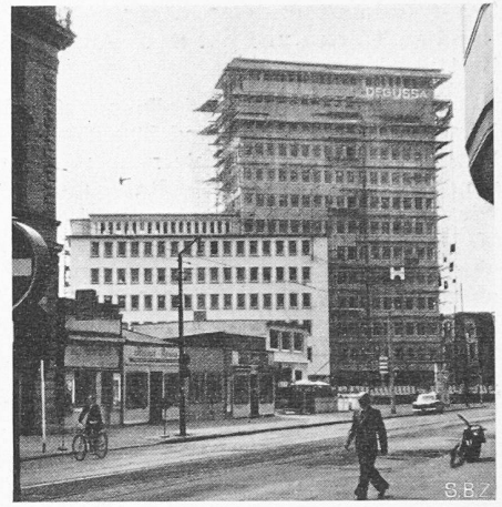
Bild 8. Dussa-Gebäude. Hochhaus mit angegliedertem, niedrigerem Geschäftstrakt. Gute städtebauliche Platzwirkung

die Beschleunigung des Verkehrs bedeutet, kann man in Frankfurt auf sehr angenehme Weise selbst erfahren, wenn man es als Zürcher noch nicht aus eigener Anschauung wusste.