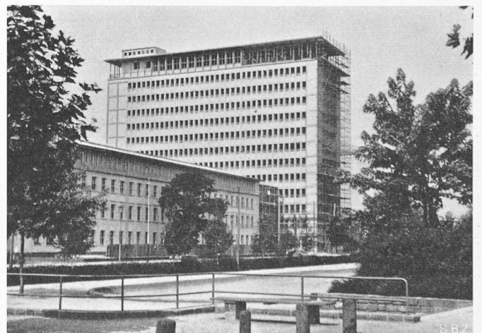
Bild 5. Hochhaus auf dem Gelände des Frankfurter Messepalastes. Angegliedert niedrigerer Bürotrakt. Hervorragende städtebauliche Gesamtwirkung

Dass die Entfernung der Strassenbahn aus den stark belasteten Verkehrszügen der City einen gewaltigen Vorteil für