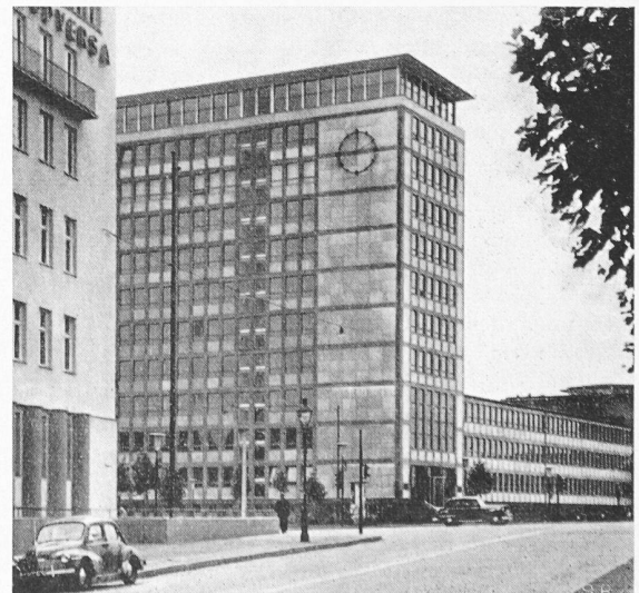
Bild 1. Hochhäuser am Mainufer. In der Nähe befinden sich weitere Hochhäuser, die dem Ufer einen beherrschenden Ausdruck verleihen. Hier wäre ein «Mehr» in Zukunft ein «Zuviel»