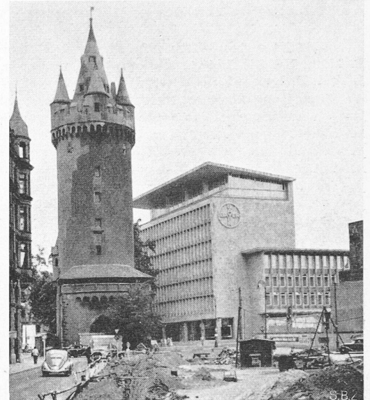
Bild 4. Das neue Bayerhaus neben einem alten, noch erhaltenen Stadttor

chenen Talent für Organisation, seiner Neigung zu grosszügiger Disposition und seiner Freude an der Arbeit an sich.