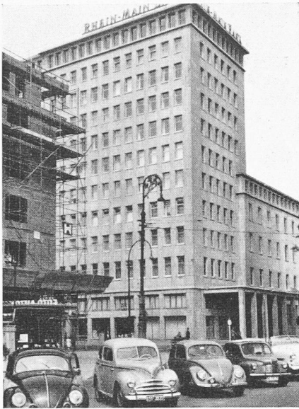
Bild 6. Das neue Gebäude der Rhein-Mainbank am Friedrich-Ebert-Platz. Konventionelle, aber gut proportionierte Architektur