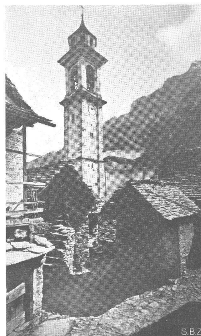
Sonogno, Val Verzasca