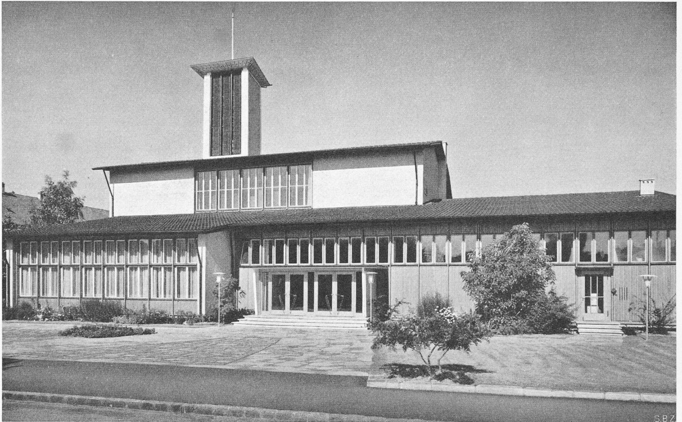
Bild 1. Die Eingangsseite an der Furkastrasse