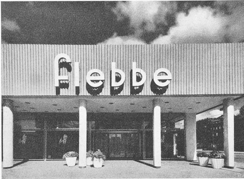
Bild 1. Geschäftshaus in Braunschweig, Behelfsdach durch Welleternit verborgen. Arch. F. W. KRAEMER