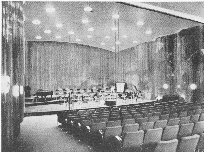
Bild 3. Konzertstudio des NWDR in Hannover. Ueber der gewellten Wandverkleidung aus Holz sind Messingflächen (zum Teil glatt, zum Teil perforiert) angebracht.

1. Jede Vervielfältigung der ungekürzten EMPA-Untersuchungsberichte, auch die Anfertigung einzelner Photokopien des ganzen Attestes, bedarf der Zustimmung der Direktion der EMPA; die Verwendung zu Werbezwecken wird zumeist ohne weiteres gestattet. Wenn ein Untersuchungsbericht aus bestimmten Gründen nur für internen Gebrauch bestimmt ist, erhält er bei seiner Ausfertigung einen entsprechenden Stempel-aufdruck.