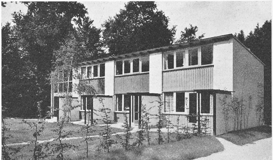
Bild 5. Reihenhäuser bei Hannover. Im Erdgeschoss Wohnräume, Küche, Bad, im Obergeschoss zwei Schlafräume und eine Kammer. Architekten HEBEBRAND, SCHLEMPF, MARSCHALL