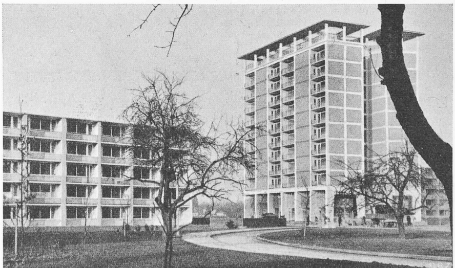
Bild 6. Wohnsiedlung in Bad Godesberg. Dreiseitig umschlossene Loggien (Schatten im Sommer, Sonneneinfall im Winter). Architekten APEL, LETOCHA, ROHRER, HERDT, RUF