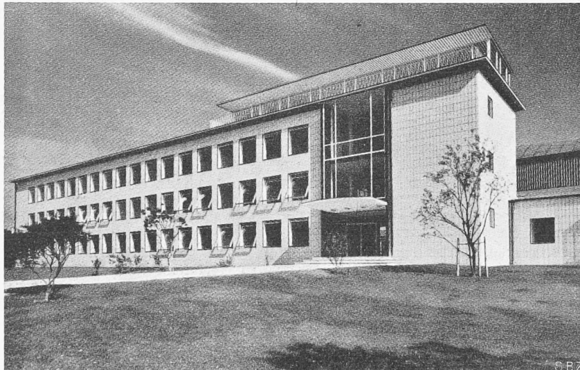
Bild 2. Rundfunkhaus des NWDR in Hannover. Architekten KRAEMER, LICHTENHAHN, OESTERLEN.