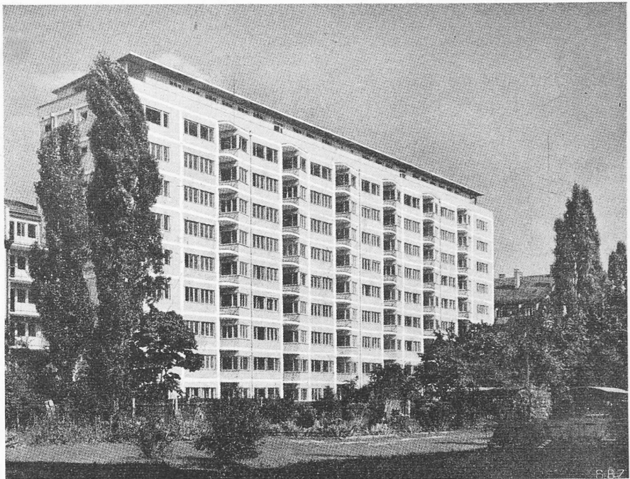
Bild 4. Wohnhochhaus in München mit 82 Eigentumswohnungen. Architekten E. M. LANG und M. ELSAESSER