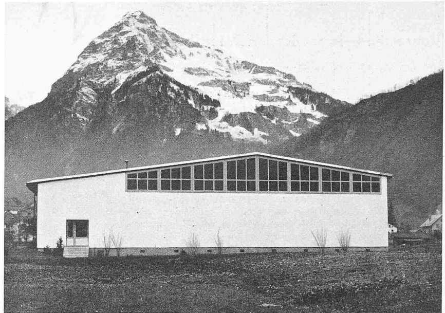
Bild 3. Nordfassade

Die Bedeutung des Kraftwerkes Jochenstein muss im Zusammenhang mit der Schiffbarmachung der Donau bis Ulm und der Ausführung der Grossschiffahrtsstrasse Rhein-Main-Donau sowie der Verbindung von der Donau (Ulm) nach dem Bodensee (Friedrichshafen) gesehen werden. Ueber diese Wasserstrassen ist hier schon zu verschiedenen Malen berichtet worden, so z. B. 1950 in Nr. 51. Die Arbeiten sind namentlich an der Mainstrecke gefördert worden, an der am 18. Juni 1954 das kanalisierte Teilstück Würzburg-Ochsenfurt dem Betrieb übergeben werden konnte. Bis Ende 1959 soll der Ausbau bis Bamberg fertiggestellt sein. Alsdann fehlt noch die Kanalstrecke mit acht Schleusen und zwei Schiffshebewerken bis zur Scheitelhaltung sowie die Kanalstrecke bis zur Einmündung in den Fluss Altmühl mit einer Schleuse und einem Hebewerk. Von dort bis zur Einmündung in die Donau sind zwei Stufen mit Kraftwerken und Schleusen auszuführen sowie drei weitere Stufen in der Donau bis Regensburg, wovon zwei mit Kraftwerken. Diesem Ausbau wird in Deutschland im Hinblick auf die wirtschaftliche Bedeutung der Schifffahrt vor allem für die Industrie in Unterfranken und Bayern allergrösste Aufmerksamkeit geschenkt.