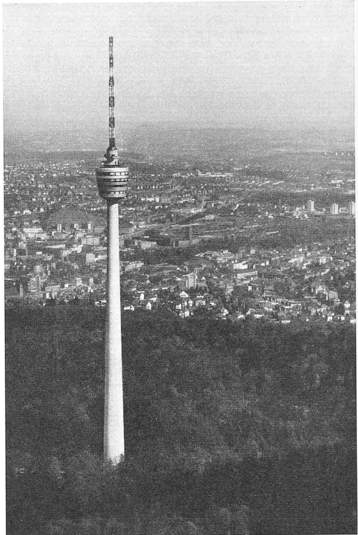
Bild 4. Turm und Stadt (Hauptbahnhof).

Die Ausbildung der Turmkopfwandung geht aus Bild 2 hervor. Zur Aussenreinigung der Fenster dient ein zusammen- klappbarer, auf die Aussichtsplattform abgestützter umlau- fender Mechanismus mit absenkbarem Wagen. Die Gasträume besitzen Klimaanlage und Deckenstrahlungsheizung. Die bei- den Gastgeschosse bieten 80 und 85 Sitzplätze. Die beiden