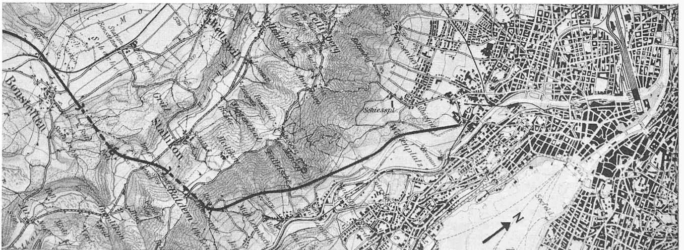
Bild 1. Vorschlag einer Autostrasse Zürich—Bonstetten mit Untertunnelung der Albiskette bei der Baldern. Masstab 1 : 55 000