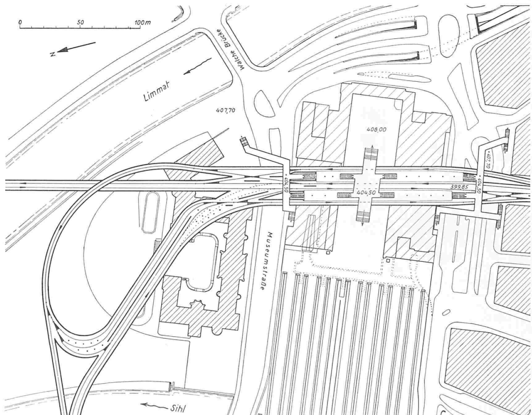
Bild 3. Hauptumsteigestation Hauptbahnhof gemäss Vorschlag Pirath-Feuchtinger im Untergrund des Aufnahmegebäudes, Massstab 1:3000. Diese im Schwerpunkt des heute schon überlasteten Kopfbau eingebaute Haltestelle und Hauptumsteigestation beansprucht oberirdischen Raum für die Zugangstreppen, der heute von der Gepäckabfertigung und von den Handgepäckschaltern belegt ist. Die 8,15 m unter der Oberfläche angeordneten Tramperrons geraten in Konflikt mit dem im SBB-Projekt 1954 immer noch vorgesehenen Tiefperron der rechtsufrigen Seebahn. Grundlegende Veränderungen des Kopfbau ziehen die Ueberprüfung der Bahnhoffrage nach sich. Die Verkehrs- und Stadtplanung Zürichs und seiner Umgebung ist ohne Koordination dieser Studien mit dem Bahnhofumbau nicht mehr möglich.