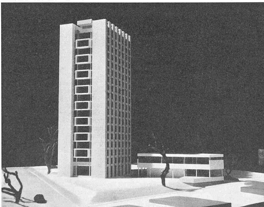
Modellbild aus Süden