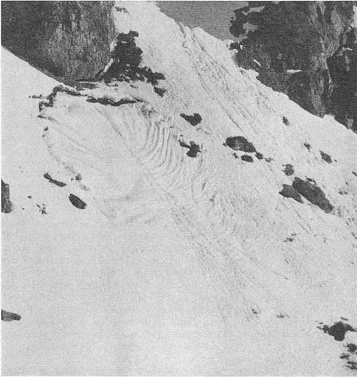
Bild 1. Beginn der Lawinenbildung in Nass-Schnee: Kriechen — Abriss — Laminares Fliessen. Mittelgrat ob Davos