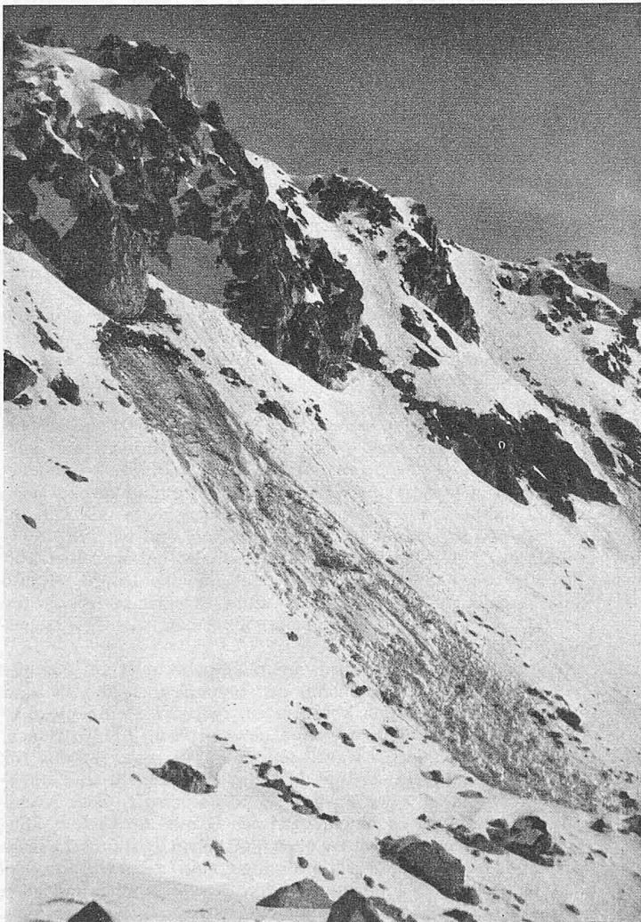
Bild 2. Weitere Entwicklung der in Bild 1 in Bildung begriffenen Lawine: Laminares Fliessen — Schollenbildung — Turbulente Bewegung. Mittelgrat ob Davos

fälliges Anpassungsvermögen sind dazu unentbehrlich. Er ist aber kein Uebler; denn seine gesellschaftliche Stellung verlangt von ihm auch künstlerische Ambitionen, die er mit all seinen besten Kräften erfüllen muss.