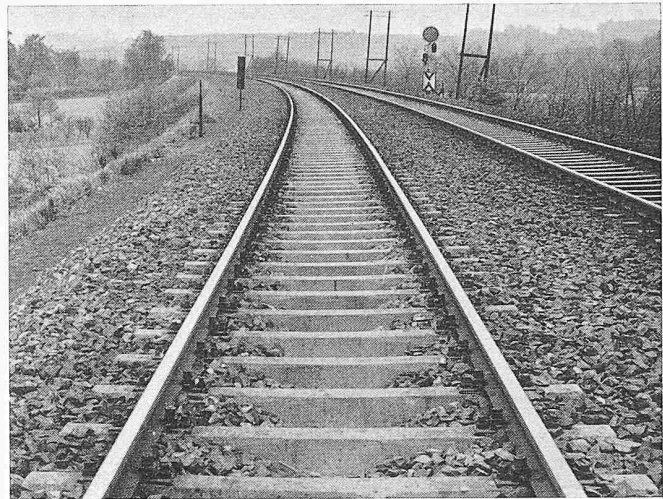
Bild 2. Die Schwelle B55 in einem Gleis der DB

In Frankreich kommt die Betonschwelle Typ RS (zwei getrennte Betonklötze mit verbindender Stahlstange als Spurhalter) billiger zu stehen als die Spannbetonschwelle, und nimmt daher einen Vorrang ein. Die Preise in Frankreich