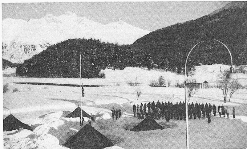
Winterolympiade St. Moritz 1948, Nordiska-Zeltlager mit etwa 100 Studenten. Unterkunft in norwegischen Armeezelten und Verpflegung aus schweizerischen Armeefeldküchen