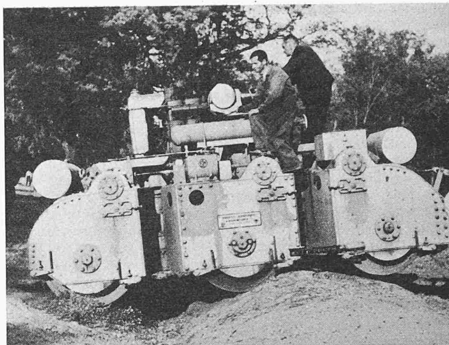
Ringsted-Triplex-Strassenwalze bei einer Demonstrationsfahrt in welligem Gelände

Mit diesem 8. Band des bekannten Handbuchs liegt nun auch in der deutschsprachigen Literatur ein Standardwerk über die Erzeugung und Anwendung von Temperaturen unter etwa -60^{\circ}\text{C} vor, verfasst von einem der besten Kenner dieses Gebietes. Ein erster Teil ist der Theorie der Gasverflüssigung und Zerlegung gewidmet (allgemeine thermodynamische