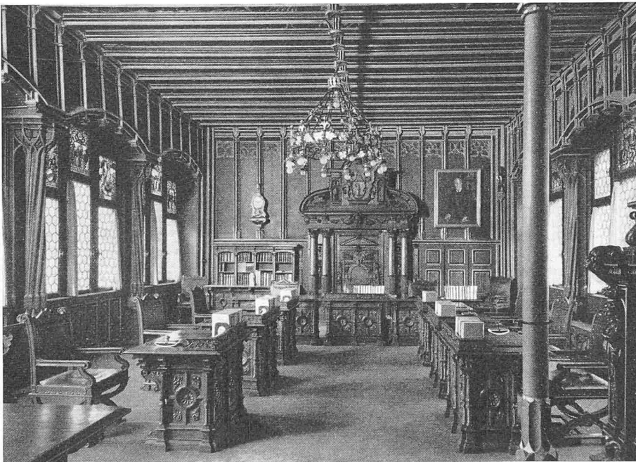
Der Basler Regierungsratsaal, oben vor, unten nach der Restaurierung.

Eine Zutat von 1595 ist das auf einem Stich des grossen französischen Architekten Du Cerceau von 1534 fus-sende Portal des welschen Bildschnitzers Franz Perser, der aus der Gegend von Besançon stammte und jedenfalls