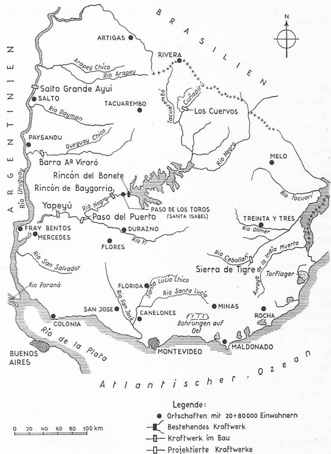
Bild 1. Uebersichtskarte der verfügbaren Wasserkräfte von Uruguay

Unmittelbar vor Ausbruch des Zweiten Weltkrieges wurde der Ausbau der vorhandenen Wasserkräfte an die Hand genommen. Der grösste Fluss des Landes, der Río Negro, dessen Quellen im südlichen Brasilien, im Staate Rio Grande do Sul, liegen, erscheint dafür am geeignetsten. Die hydrologischen Verhältnisse des Landes sind eigenartig. In Uruguay gibt es keine ausgesprochene Regenzeit; beinahe zu jeder Jahreszeit können gewaltige Regenfälle oder aber auch ausgedehnte Trockenperioden auftreten. Die Regenmenge am Mittellauf des Río Negro, bei der Pegelstation Paso de los Toros, beziffert sich etwa auf 1150 mm im Jahr. Die Wasserführung des Río Negro zeigt viel ausgeprägtere extreme Wasserstände als die europäischen und schweizerischen Flüsse. An der Pegelstation Paso de los Toros wurden in der 38jährigen Beobachtungsperiode 1908—1945 als kleinste Wasserführung 1,0 m 3 /s festgestellt; als Katastrophenhochwasser sind 11 500 m 3 /s zu erwarten. Aber nicht nur die sekundliche Ergiebigkeit des Flusses zeigt derart grosse Schwankungen, sondern auch die jährliche Gesamt-