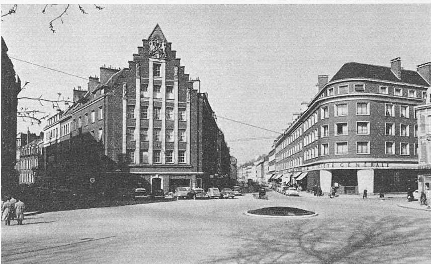
Amiens, Place René Goblet