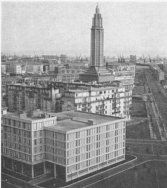
Le Havre, Boulevard François 1er

Nous essayons d'en extraire les points les plus brillants, en donnant ci-après un résumé de la reconstruction dans