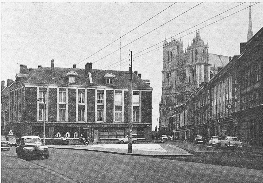
Amiens, Rue Deserel et Cathédrale