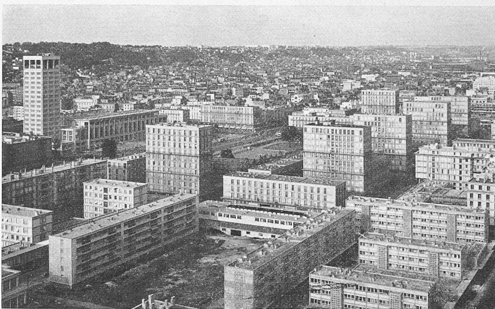
Le Havre, ensemble I. C. E., de l'Hôtel de ville