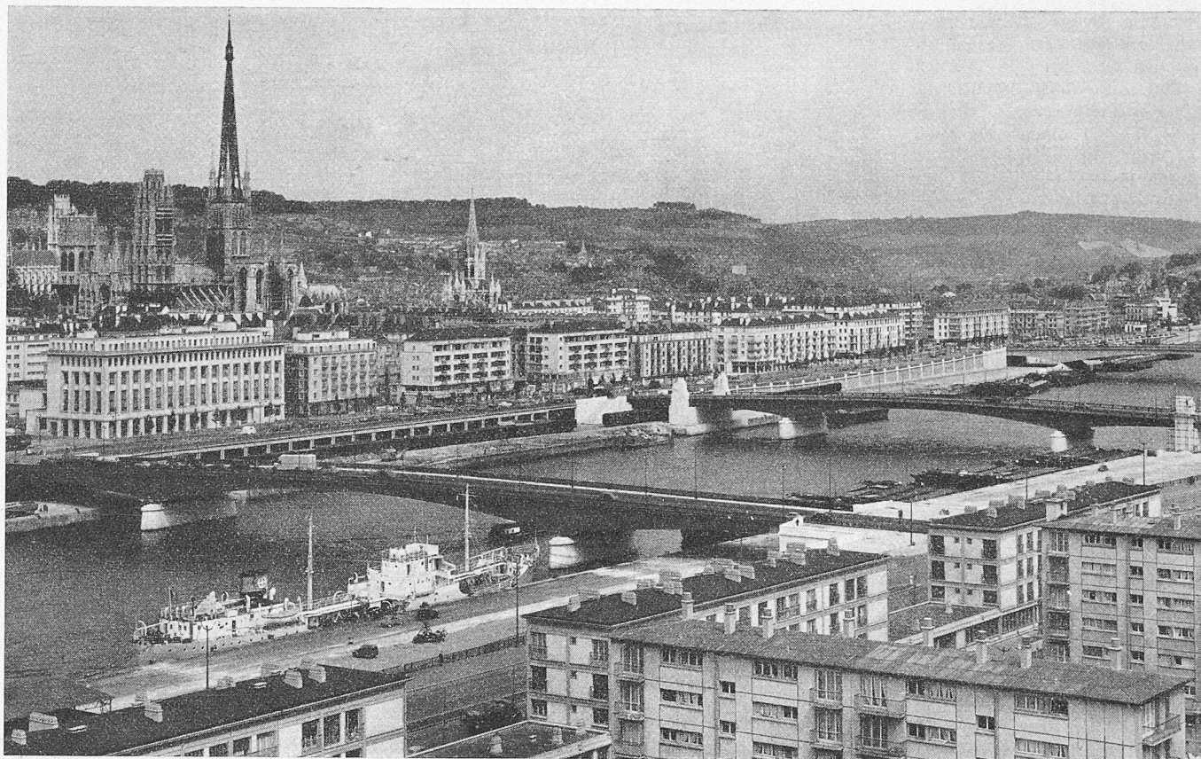
Rouen, vue générale des quais rive droite

des habitants se manifesta par la réouverture de centres commerciaux. Le plan d'urbanisme de la nouvelle cité fut approuvé en 1942, mais ce n'est que le 12 mars 1947 que pu être déclarée l'ouverture de la période de reconstruction. Contre vents et marées s'activèrent les chantiers de constructions, d'Etat, individuelles et collectives, les chantiers des sinistrés prioritaires, des constructions expérimentales.