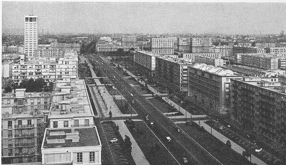
Le Havre, Boulevard Foch

Les travaux étant interdits pendant l'occupation allemande, seules quelques constructions provisoires légères et sans confort purent être édifiées de 1940 à 1944. Le courage