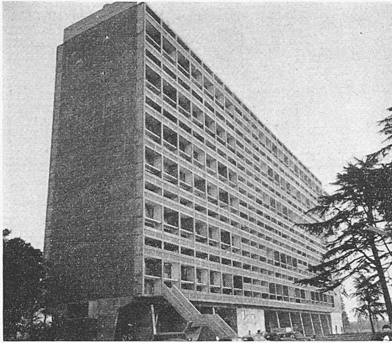
Nantes, Unité d'habitation, arch. Le Corbusier