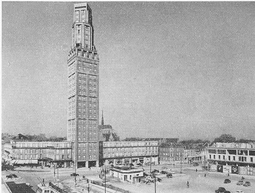
Amiens, place Alphonse Fiquet et Tour Perret, haute de 104 m

Die Studienreise nach Skandinavien , die der Verband mit 28 Teilnehmern im vergangenen Sommer durchgeführt hat, muss ein ausserordentliches Erlebnis