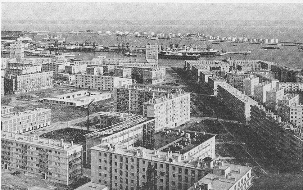
Le Havre, immeubles entre Rue de Paris et Bd. Clemenceau