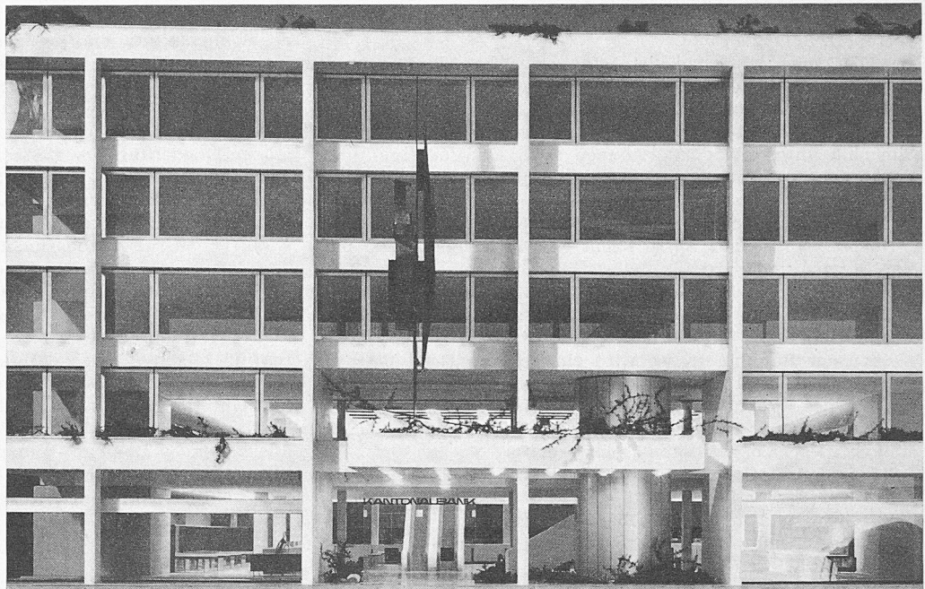
Detail der Fassadengestaltung, Haupteingang mit Plastik