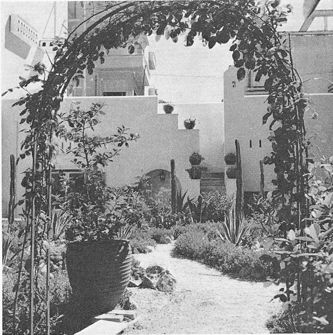
Kleiner Garten in einem Hof im Zentrum von Athen

haben eine grosse Aufgabe an ihnen zu lösen. Hauptsächlich den jungen, neuen Völkern, die sich jetzt erst an ihre Industrialisierung machen, muss geholfen werden. Not ist ein schlechter Ratgeber, und Europa hat von ihr mehr zu fürchten, als von gut entwickelten Staatsgebilden, die auf einem hohen Lebensstandard stehen.