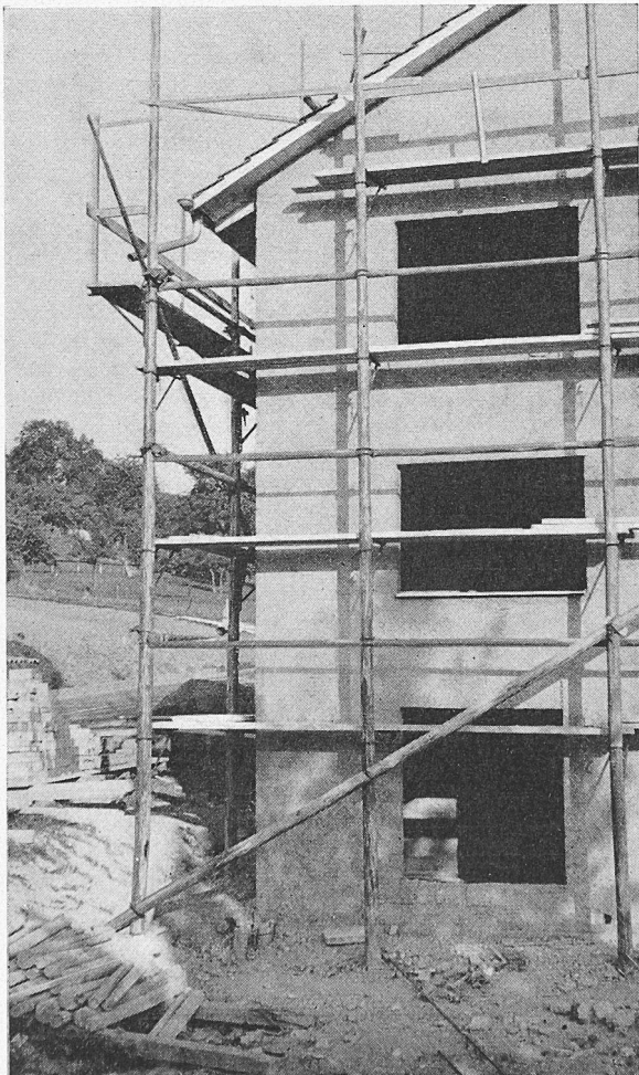
Gerüst mit Laufgang für Dachgesimsarbeiten

Die übliche Praxis, die schnell zur Verwirklichung des Projektes führt, ist die des geringsten Widerstandes und geht folgendermassen vor sich: In der Altstadt wird «altstädtisch», d. h. irgendwie das neue Gebäude der Nachbarschaft «im Stil» angepasst, gebaut. Unter «altstädtisch» versteht man grosso modo Giebel- oder Walmdach, kleine Fensterteilung, Fensterbrüstungen, Gesimse, alles wenn möglich Bruch- oder Sandstein, oder eben so wirkender Kunststein oder angestrichener Beton. Welcher Stil dabei verwendet wird, ist eigentlich egal, Hauptsache, dass dem neugeprägten Mischmasch aus sämtlichen Stilelementen der Vergangenheit entsprochen wird. Das gleiche Ziel des Angleichens kann man auch durch das blosse Wiederaufkleben der alten Fassade vor Stahlskelette usw. erreichen. Das alles ist landläufige, nicht nur geduldete, sondern empfohlene Architektur.