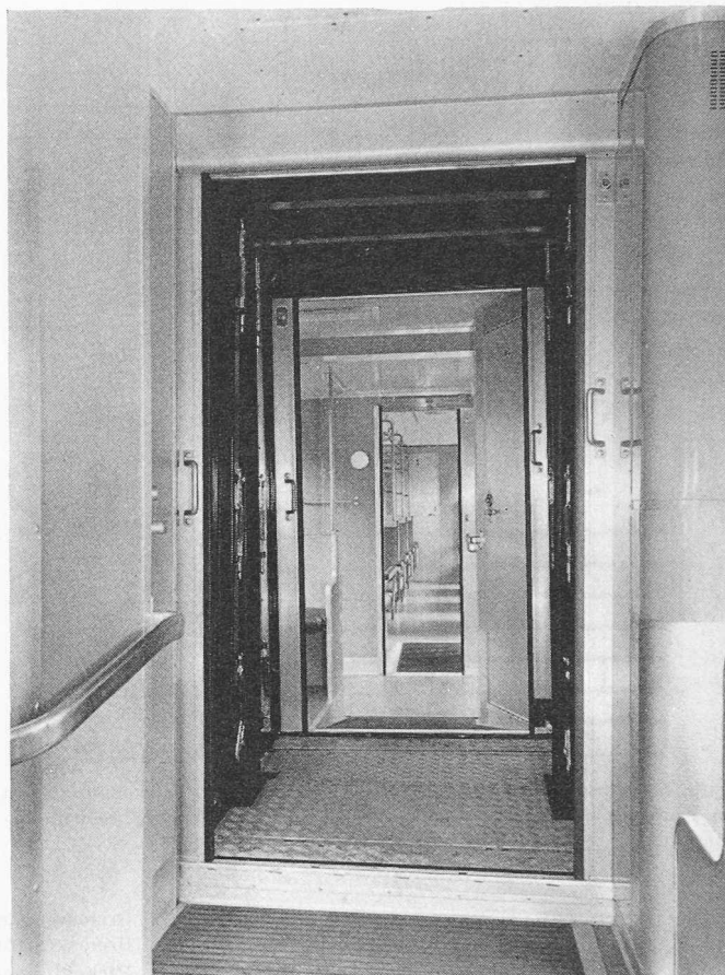
Bild 10. Blick durch einen Wagenübergang

für je vier Plätze 130 bis 150 Lux erreicht. Für den Betrieb vorteilhaft ist der Umstand, dass dank dieser Beleuchtungsart die nötigen Batterieauswechslungen stark verringert werden können.