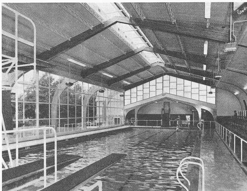
Innenansicht der Schwimmhalle in Ludlow, England, mit Dreigelenkbindern aus lamellenverleimten Holzbogen

Viertakt-Dieselmotor von Deutz für 3000 PS. Die Baureihe der seit Anfang 1958 serienmässig hergestellten sechs- und achtzylindrigen Motoren in V-Form von 400 mm Bohrung und 580 mm Hub ist durch einen Typ mit zwölf Zylindern und 500 mm Hub erweitert worden, der als Schiffsmotor bei 350 U/min 3000 PS leistet, als stationäre Maschine mit 360 U/min bzw. mit 375 U/min betrieben werden und dabei 3100 bzw. 3200 PS abgeben kann. Der mittlere Nutzdruk beträgt 10,3 bzw. 10,2 kg/cm 2 , das Gewicht ohne