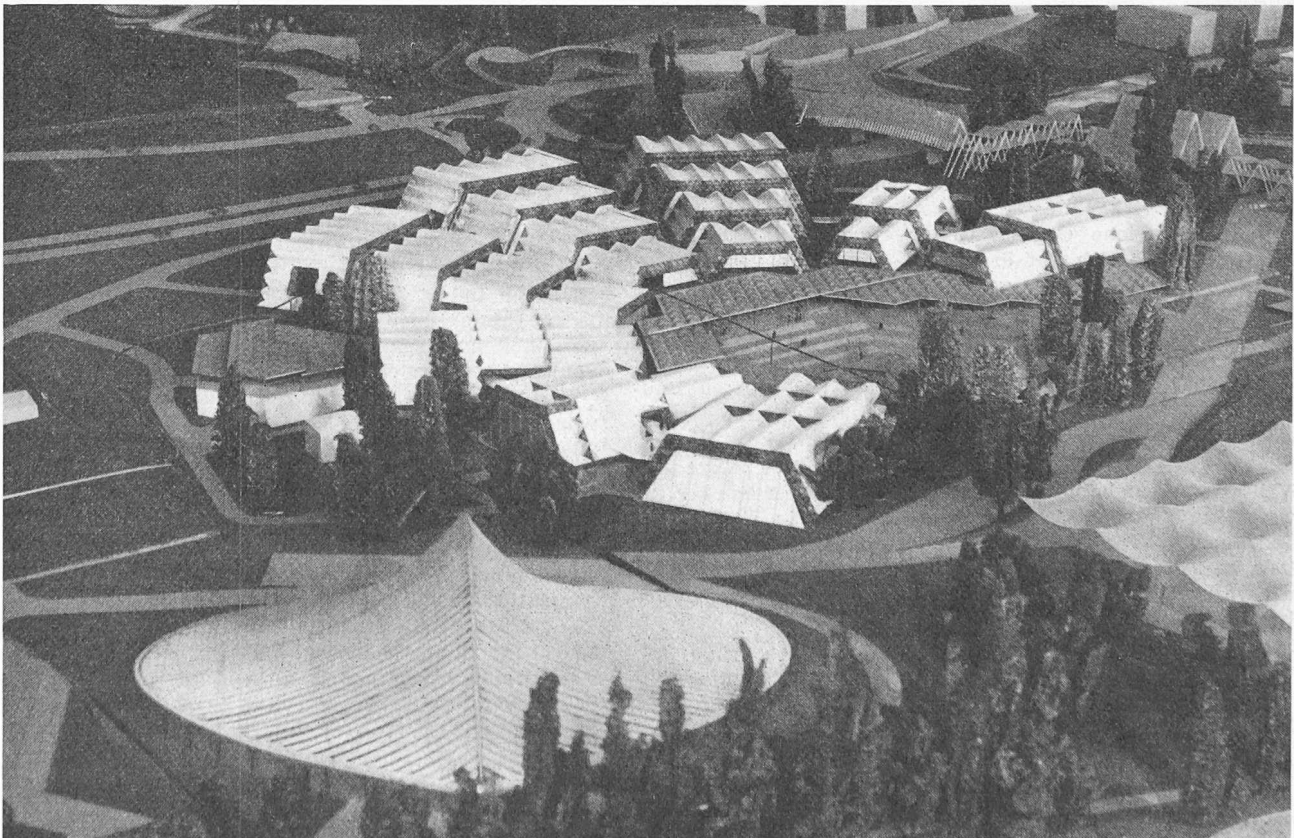
Industrie und Gewerbe. Im Vordergrund die Festhalle

Dieser Sektor, dessen Hauptthema «Die Grundlagen der industriellen und gewerblichen Tätigkeit» heisst, wird die fundamentalen Probleme unserer industriellen und gewerblichen Entwicklung zeigen. Er wird insbesondere darauf hinweisen, wie wichtig es ist, die Fabrikationsprogramme unserer Werkstätten gut aufeinander auszurichten. Diese müssen immer mehr auf die Schaffung hochspezialisierter Erzeugnisse hinarbeiten, die nicht nur durch ihre Präzision und den bedeutenden Arbeitsaufwand, den sie voraussetzen, sondern auch durch den Erfindungsgeist, der ihnen zugrunde liegt, durch technisches Können und durch die zu ihrer Herstellung erforderlichen beträchtlichen Kapitalien gekennzeichnet sind.