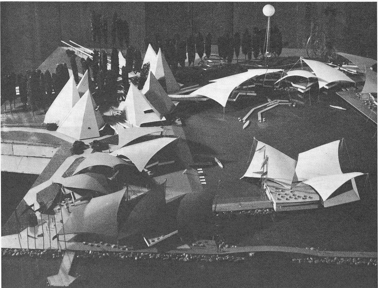
Hafensektor. Die touristische Schweiz

Auf einer kleinen künstlichen Insel findet sich das Casino, eine Einrichtung, die aus dem Fremdenverkehr nicht mehr wegzudenken ist. Als architektonisches Element gestattet es die Gliederung des Hafenbeckens; seine drei Dachsegel, die sich wie Schwurfinger in die Luft recken, stellen symbolisch das Schweizer Schiff auf seiner Fahrt in das neue Europa dar.