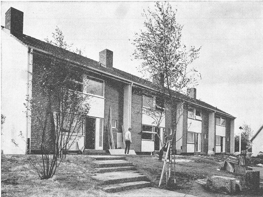
Haus 18—21. Finnische Reihenhäuser der Firma Puutalo. Je 4 Zimmer auf 2 Geschossen, 108 m 2 Wohnfläche, 300 m 2 Grundstück, Preis ab Oberkante Keller 53 000 Mark; Gesamtpreis 97 500 Mark; vollunterkellert. — Neben dem Keller sind die Brandmauern zwischen den einzelnen Häusern in konventionellem Ziegelmauerwerk ausgeführt; alles andere besteht aus vorfabrizierten Holzelementen mit Isoliermaterialien. Montagedauer zwei Wochen. Reichhaltiges Typenprogramm von Einzel- und Reihenhäusern in allen Grössenordnungen.

sische Statistische Amt hat in entgegenkommender Weise die Tabellierung der Ergebnisse übernommen. So ist es möglich, dass die Resultate jeweils bereits drei Wochen nach Monatsende zur Verfügung stehen.