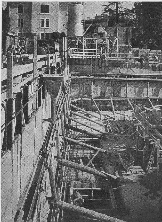
Baugrube mit Rühlwandverankerung