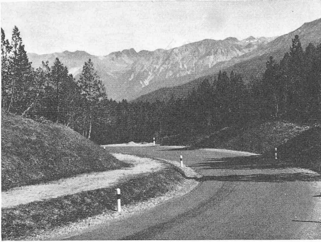
Bild 5. Sterile Kalkschotterböschungen an der Ofenbergstrasse, etwa drei Monate nach Begrünung mittels Saat auf Stroheckschicht. 1700 m Seehöhe