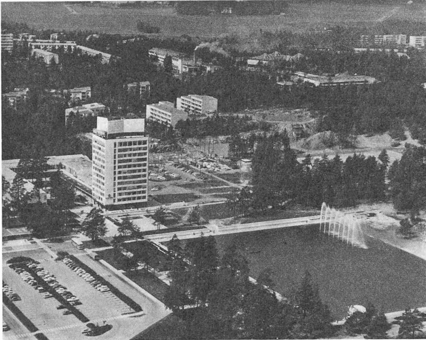
Gartenstadt Tapiola, an einer Bucht des Finnischen Meerbusens, rund 15 km westlich von Helsinki. Versuch einer Satellitensiedlung mit 4600 Wohneinheiten, wovon 4400 erstellt sind. Tapiola soll ein selbständiges Gemeinwesen mit einer organischen Sozialstruktur für maximal 17 000 Bewohner werden (d. h. etwa 63 Personen je ha). Das dreizehnstöckige Hochhaus an einem künstlichen kleinen See markiert das Stadtzentrum (Architekt Aarne Ervi)